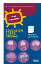
Fichas de preguntas